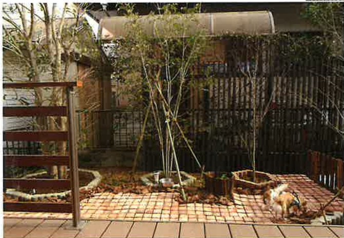
あまり人目が気にならないよう、隣家との境に縦格子のフェンスを設置し特に気になる部分にはポリウムのある株立の雑木を配し目隠しをしました。