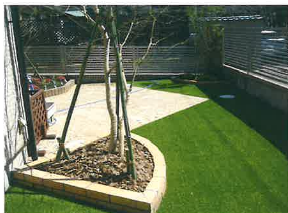
スタンプコンクリートと人工芝は、なるべく段差の無いように施工しました。レンガ囲いの植え込みにはウッドチップを敷き、土が表面に露出しない様にしました。

ペットの排泄物も水で流せるよう、デザインにも優れ、日光の照り返しの少ないスタンプコンクリートを土間に施工し、そのほかの部分にはペットの足に優しい素材で手入れの必要のない人工芝を張りました。その事でペットが汚れる事なく思い切り走り回れるペットガーデンになりました。