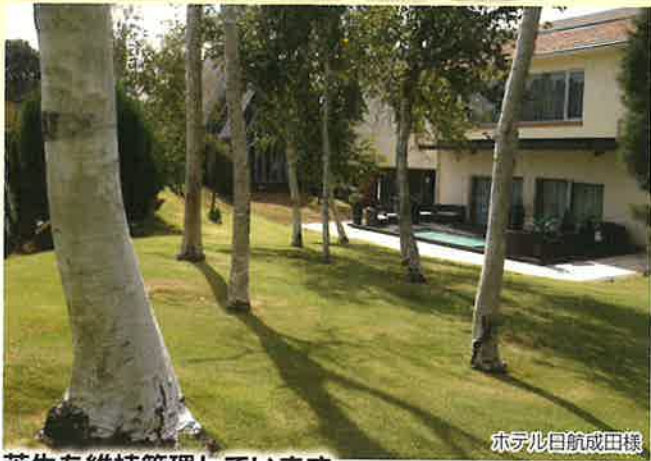
ホテル日航成田様