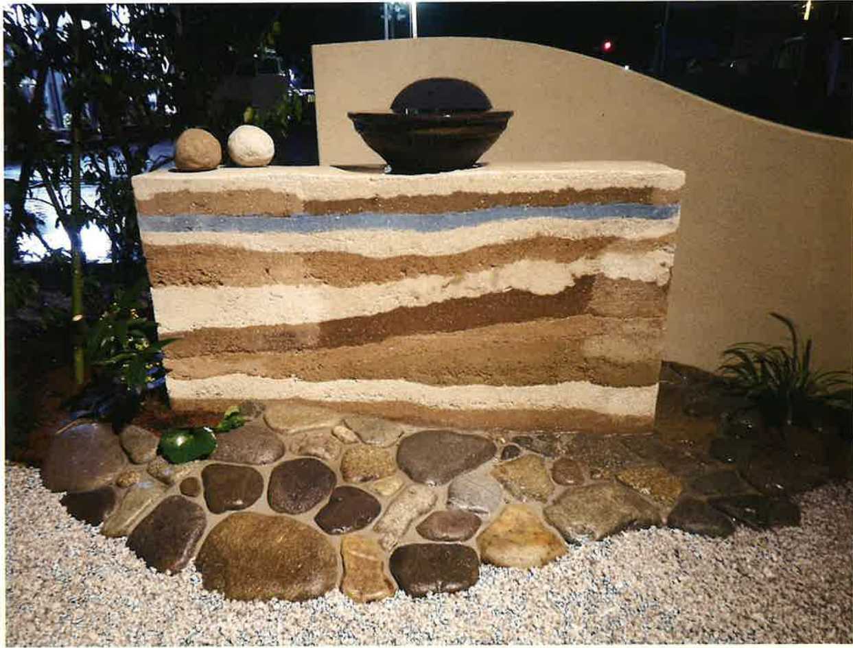
家族葬邸宅「ソラエ」様

この庭のテーマは「囲む」。 家族団欒をイメージし、「人が腕を広げて囲んでいる」姿を表しました。 色々な景色に変化し、ゆったりと時が流れるさまを庭に託しました。 お施主様の思い(夢)を心を込めて造る理由が中ページに記されてあります。